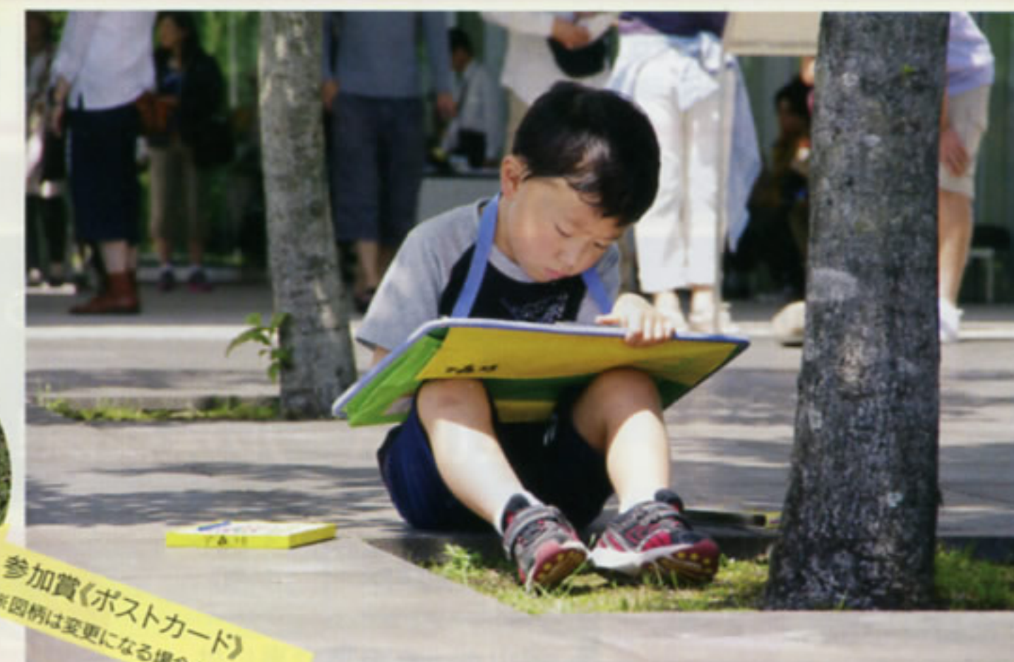
参加賞(ポストカード) ※図柄は変更になる場合もあります。