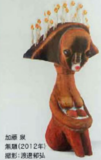
加藤泉 氣韻(2012年)

開演時間/9:00~17:00 (入場は16:30まで) 月曜日休館(祝日の場合は翌日休館)