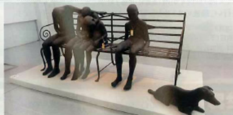
「絶滅に向かった種族(2319-2322)」(1992) オノ・ヨーコ ブロンズ粉滑入樹脂、石膏 他

●霧島アートの森では、屋内の収蔵作家38人の作品を、年間3回に分けて、テーマを決めてコレクション展として展示・公開しています。国内外で広く活躍している現代作家の多様な素材による作品を、作品解説カードを手がかりに、作品との対話を楽しみながら鑑賞できる空間になっています。