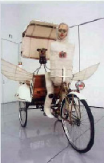
「栄光の車」(2001) ヘリドノ ヘンヤ、田、木、鉄、布、ガラス、アクリル、 ラッカー、に彫る Approx. H205×W168×D225cm

霧島アートの森では、屋内の収蔵作家30人の作品を、年間4回に分けて、 テーマを決めてコレクション展として展示・公開しています。国内外で広く 活躍している現代作家の多様な素材による作品を、作品解説カードを手 がかりに、作品との対話を楽しみながら鑑賞できる空間になっています。