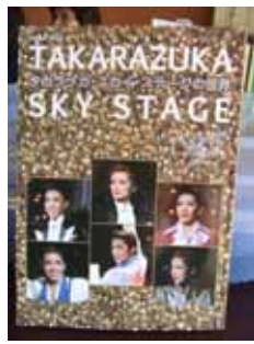
タカラヅカ・スカイステージの世界