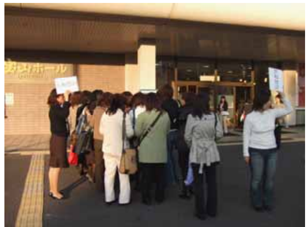
大和悠河ファンクラブの皆さん