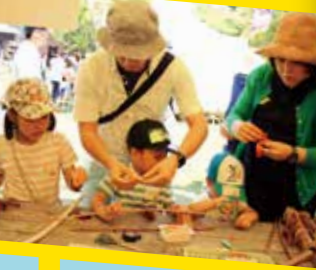
矢筒作り(フェア限定)