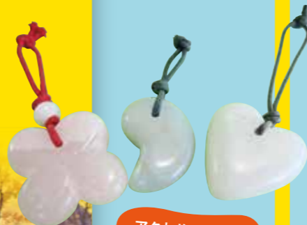
アクセサリー作り