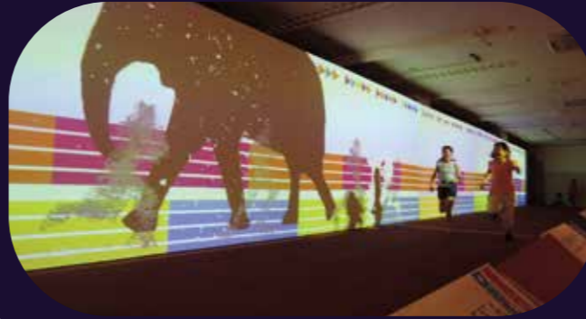
スポーツタイムマシン山口より(2013年)

観覧料(入園料に含む) 一般:320(250)円/高大生:210(160)円/小中生:150(120)円/幼児以下無料 ※( )内は20人以上の団体料金 ※鹿児島県内の70歳以上は無料(確認書類が必要) ※鹿児島県内の小中高生は土・日・祝日無料(確認書類が必要)