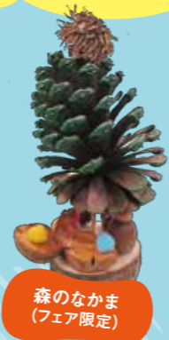
森のなかま (フェア限定)

みんなで楽しく 古代の人々の生活を 体感しよう!! フェア限定の 体験もあるよ!