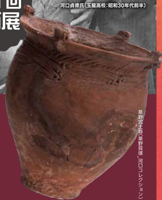
草野式土器(草野野原塚・河ロコレクション)

期間 令和6年12月21日(土)～令和7年3月9日(日) 【場所】展示館企画展示室 【入場料】展示館利用料金(一般320円/高・大210円/小・中150円)